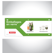
Consignes De Tri (exemple)