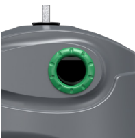
Verre Vert RAL 6010-6018