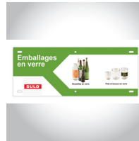
Consignes De Tri (exemple)