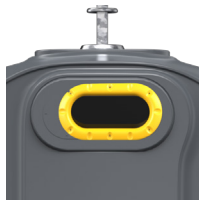
Emballage Jaune Zinc RAL 1018