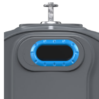
Papier Bleu Ciel RAL 5015