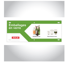
Consignes De Tri (exemple)