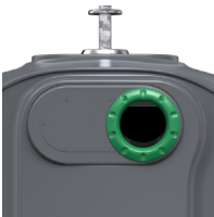
Verre Vert RAL 6010-6018