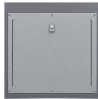
Trappe Gros Producteur