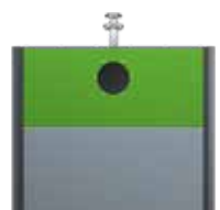
Verre Vert Jaune RAL 6018