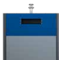
Papier EPDM Bleu De Sécurité RAL 5005