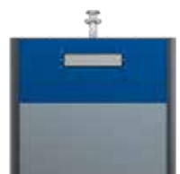
Papier Alu Bleu De Sécurité RAL 5005