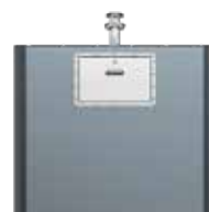
Trappe Gros Producteur