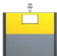
Emballage Jaune Zinc RAL 1018