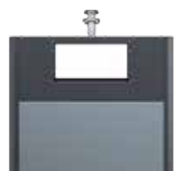
OM Alu Gris ardoise RAL 7015