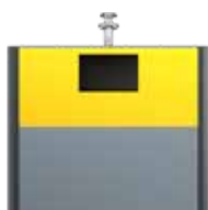
Emballage EPDM Jaune Zinc RAL 1018