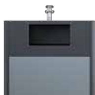
OM EPDM Gris ardoise RAL 7015