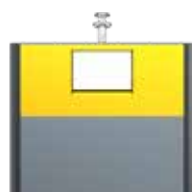
Extension Consignes De Tri Alu Jaune Zinc RAL 1018