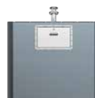
Trappe Gros Pro- ducteur