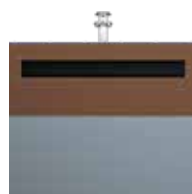
Carton EPDM Brun pâle RAL 8025