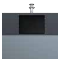
OM EPDM XL Gris ardoise RAL 7015