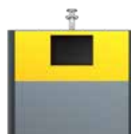
Extension Consignes De Tri EPDM Jaune Zinc RAL 1018