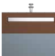
Carton Alu Brun pâle RAL 8025